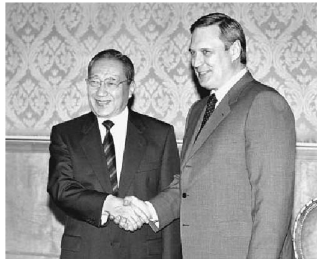
7月17日,国务院副总理李岚清在莫斯科会见俄罗斯总理卡西亚诺夫。

目430多个。从去年7月第三批援藏工作开始,两省很快又确定援藏项目各70个,计划总投资4.6亿美元,同时还确定了一批援建储备项目。 几年来,两省的援建工作实现了五个方面的转变,即资金投入从分散的、一般的项目向集中的、重点的建设项目转变;项目规划从形象工程向造血型、生产型转变;援建重点从