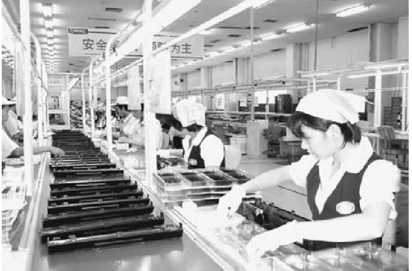
华录职工以饱满的精神状态为实现集团的年度目标而辛勤工作。

投产之时并不景气的中国华录电子集团有限公司,如今已成为我国唯一具备DVD激光头、光驱、机芯及整机制造能力的数字视听产品基地。 1995年的华录,400名员工下岗,亏损2.6亿元。 1999年,华录实现了公司成立以来的首次盈利;2000年,实现利润6200万元;2001年,利润增至1.49亿元。今年1-6月,完成销售收入17.56亿元,实现利润1.113亿元,同比分别增长160%和286%。 “华录扭亏脱困、快速发展得益于一个‘变’字。”华录集团董事长王松山认为,围绕市场变化进行的产品结构、市场结构、产业结构的调整,以及支撑结构调整的管理体制、机制和观念的转变,不仅让华录起死回生,而且让企业脱胎换骨,进入了良性发展的新阶段。 结构调整带来生机 1994年的华录,真可谓“生不逢时”。作为一家计划投资20亿元、引进松下最先进的技术和设备、专门为中国9家录像机定点生产企业提供关键零部件的企业,华录曾承载着国家避免录像机关键技术及生产线重复引进的重任。